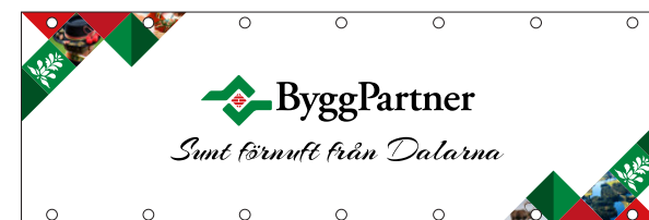
08 BANDEROLL 3000

Banderoll-designen förutsätter att trycket görs i fyrfärgstryck. Om endast vektoriserad grafik kan tryckas, kontakta Helikopter Brand Design, Hanna Johansson på telefon 076-232 23 17 för alternativ design utan fotografier.